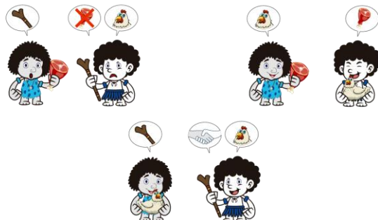
通过换取另一物品进行交换